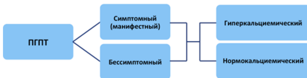
Рис.1 Классификация ПГПТ

Наиболее часто диагностируется гиперкальциемический вариант ПГПТ , характеризующийся повышением уровня кальция сыворотки крови в сочетании с повышенным (редко высоко-нормальным) уровнем ПТГ. Однако ПГПТ не всегда сопровождается повышением уровня кальция крови выше верхней границы референсного диапазона. Нормокальциемия может быть транзиторной при гиперкальциемическом варианте и стойкой при нормокальциемическом варианте заболевания. Нормокальциемический вариант ПГПТ (нПГПТ) характеризуется неизменно верхненормальным уровнем общего и ионизированного кальция в сыворотке крови в сочетании со стойким повышением уровня ПТГ, в отсутствие очевидных причин вторичного гиперпаратиреоза (дефицит витамина D, патология печени и почек, синдром мальабсорбции, гиперкальциурии и др.) [11, 17]. Классификация ПГПТ представлена на рис. 1.